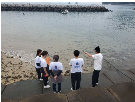
協力企業の方からのレクチャー