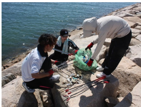
堤防でのごみ回収