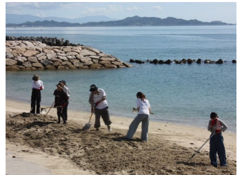
ビーチクリーンの様子(砂おろし)