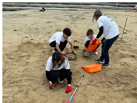
ビーチでのご石拾い