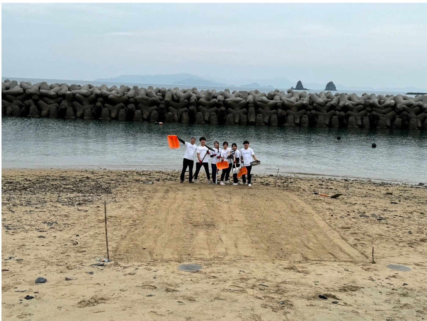
参加したメンバーと整地したビーチ（11月実施）