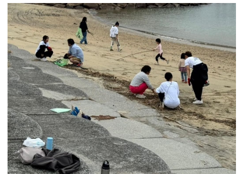
他ボランティア団体との交流