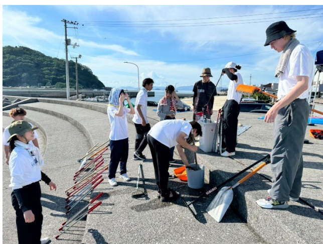
後片付けの様子（7月実施）