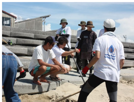
地域の方との共同作業