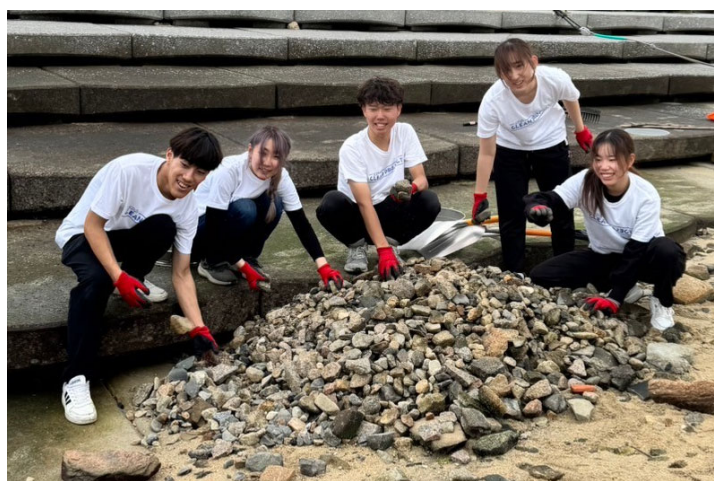
ビーチクリーン後の様子（11月実施）