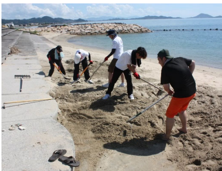
階段からの砂おろし