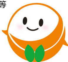
愛媛大学マスコットキャラクター えみか