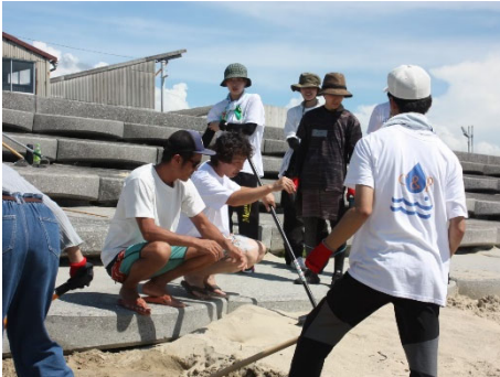
協力企業の方からのレクチャー