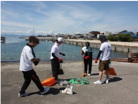
土手内漁港でのごみ回収