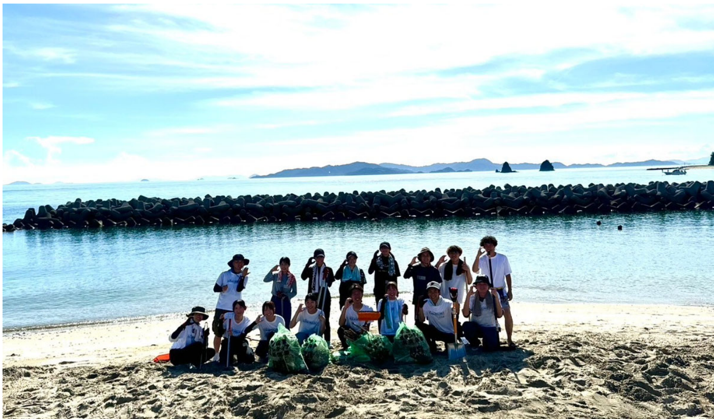
参加したメンバーと収集したゴミ