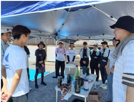
オリエンテーション