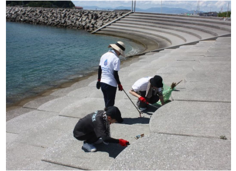
砂浜階段のごみ回収