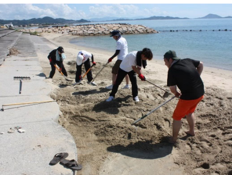
地域の方との共同作業