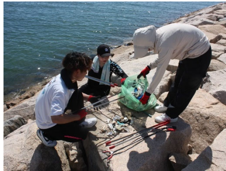
堤防でのごみ回収