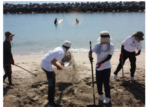
ビーチクリーンの様子 2