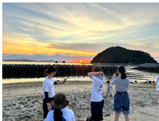
ビーチクリーン後の交流の様子