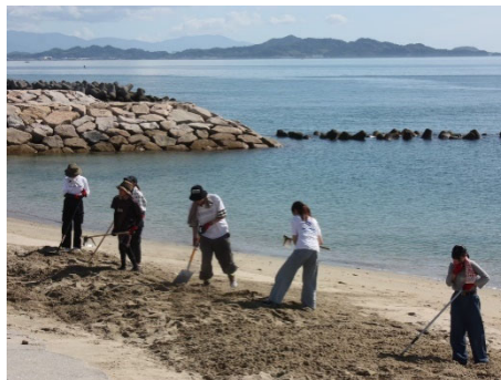
ビーチクリーンの様子 1