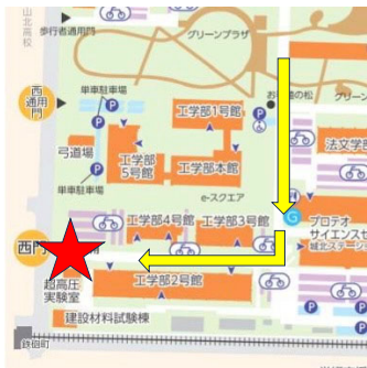
引用：愛媛大学 HP 城北キャンパス マップ