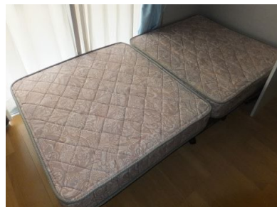
ベッドマット 開いた状態