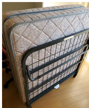
ベッドマット 閉じた状態