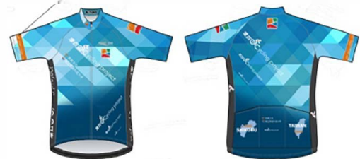
オリジナルサイクリングジャージ

オリジナルサイクリングジャージを作成します。 ※参加費に含まれています。 ※サイズ等は実施要項を参照してください。