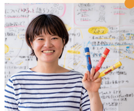
グラフィック・レコーディング