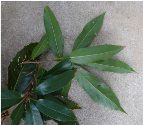
図1 ハナガガシの枝葉