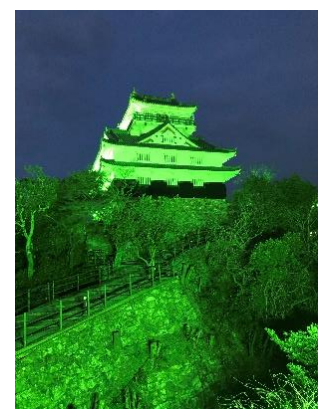
2019年世界緑内障週間に、グリーンにライトアップされた岐阜城

日本緑内障学会では学術研究活動とは別に啓発活動も重要な事業と考えております。世界緑内障週間（World Glaucoma Week, WGW）とは、世界緑内障連盟（World Glaucoma Association, WGA）が実行組織となって、2008年から世界一斉に行われてきた緑内障啓発のための国際的なイベントです。毎年3月上旬の一週間に、世界各地で各国・各地域の実情に合わせて様々な活動を行います。日本においても、講演会と眼科検診等を行ってまいりましたが、2015年に新しい取り組みとして、緑色の光を使ったライトアップを全国で5カ所の施設で試験実施いたしました。結果として、今まで、関心のなかった一般市民に対する啓発効果が思いのほか大きいことがわかり、以後この運動を学会の公式事業といたしました。伝えたいメッセージは、「早期発見・継続治療」と「希望」です。「希望」には仲間と家族と主治医とともに治療をして「あなたの眼がずっと見えていますように」という思いを込めています。日本緑内障学会は、各地のランドマークとしての公共機関や医療機関等をグリーンにライトアップする活動を通して、より多くの人に緑内障という眼の疾患に関心を持っていただき、早期発見をし、きちんと治療を継続することで高齢になっても日常生活に支障をきたすことのないように願うものです。ご理解ご協力のほどをよろしくお願い致します。