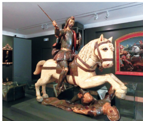
スペイン・ガリシア州立巡礼博物館のヤコブ像