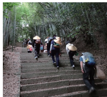
愛媛大学生と遍路道を歩く

国内研究部門では、四国遍路の古代から現代までの歴史的諸相を学際的に解明し、また現代遍路の多様な実態をフィールド調査などを通して具体的に明らかにします。国際研究部門では、世界各地の巡礼の歴史や現在の諸様相を明らかにし、あわせて四国遍路と世界の巡礼との国際比較を行います。