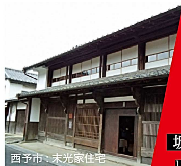
西予市：末光家住宅

妖怪が暗夜に練り歩くことを「百鬼夜行」というそうです。この「百鬼夜行」の意味をもとに、100人の老若男女が100の器を持って和紅茶会を開催し、卯之町の古い町並みを練り歩くことをイメージして「百器紅茶会」と名付けました。百器紅茶会とは、妖怪ではなく愉快な人々が集う和のティーパーティーです。ここから新しい西予市が生まれます。