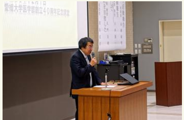
高田センター長の挨拶