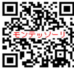
動画 5分でわかるモンテッソーリ教育