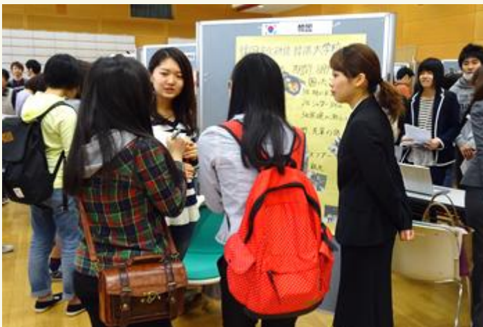
来場者へ説明する留学経験者

本学では, 短期・長期の留学や, 語学・文化研修に関心を持ち, 積極的に挑戦しようとする学生が増加傾向にあり, 留学相談室に足を運ぶ学生も増えてきています。今後も本学の海外留学・研修情報の集約を行い, 海外留学を考える学生の皆さんへ積極的に情報提供を行う予定です。