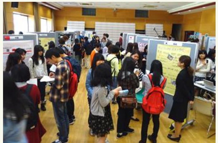
賑わう会場の様子